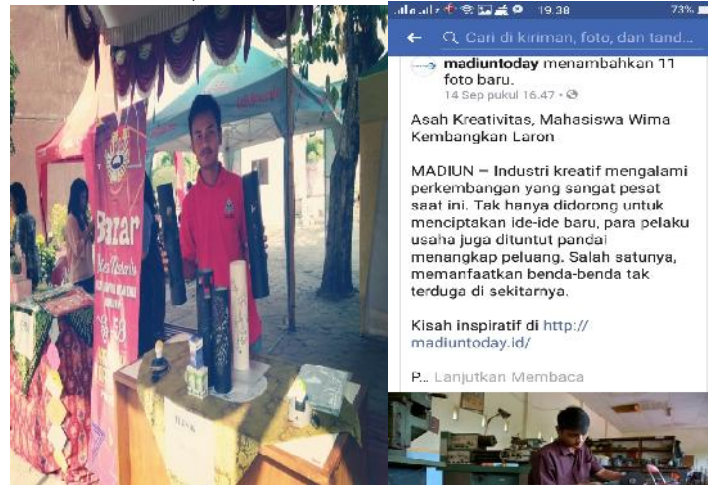
Gambar 9. Bazar Produk Tenant dan Tampilan Web Madiun to Day

baik melalui metode off line (bazar, event Car Free Day , word of mouth marketing ) dan on line dan medsos ( Madiun to Day , FB, IG, WA, marketplace PPK WIMA ).