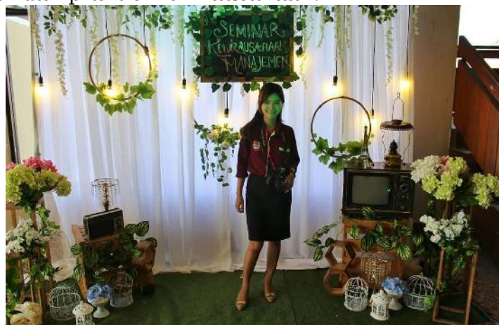
Gambar 4. Contoh Jasa Dekorasi Tenant (Flamingo Sweet Table Planner)

Fase ini merupakan starting point dalam membangun kapabilitas wirausaha mahasiswa atau melalui recruitment test dan pelaksanaan perkuliahan, tes potensi kewirausahaan dan tes kepribadian, dan/atau seminar kewirausahaan ( entrepreneurship ) yang difasilitasi oleh dosen kewirausahaan dan praktisi kewirausahaan.