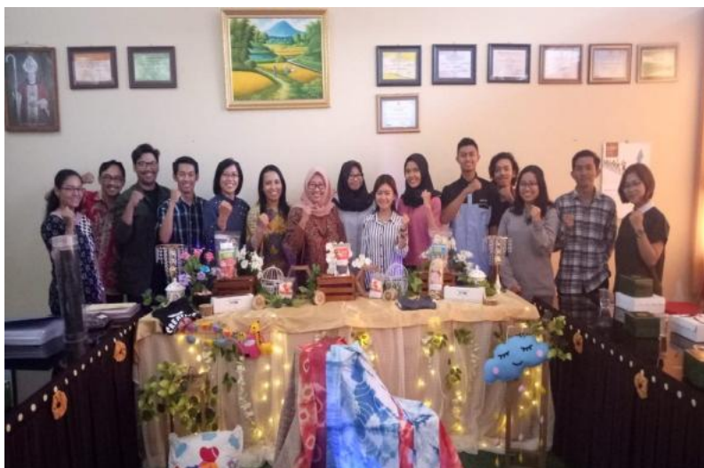
Gambar 12. Monev Lapangan Dikti