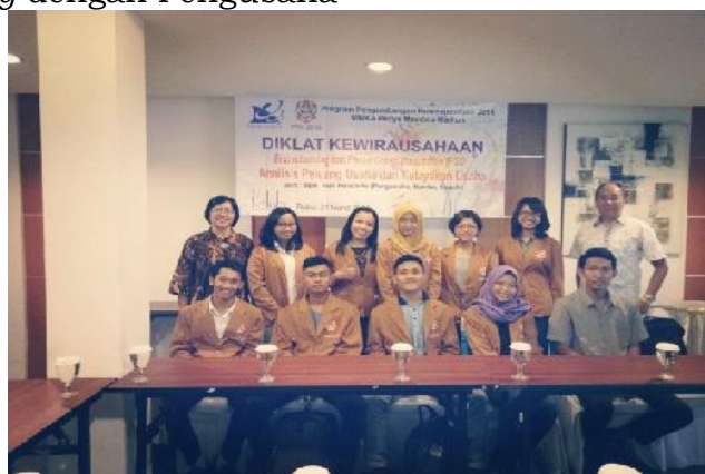
Gambar 5. FGD Para Tenant dengan Pengusaha (I-Club Madiun)