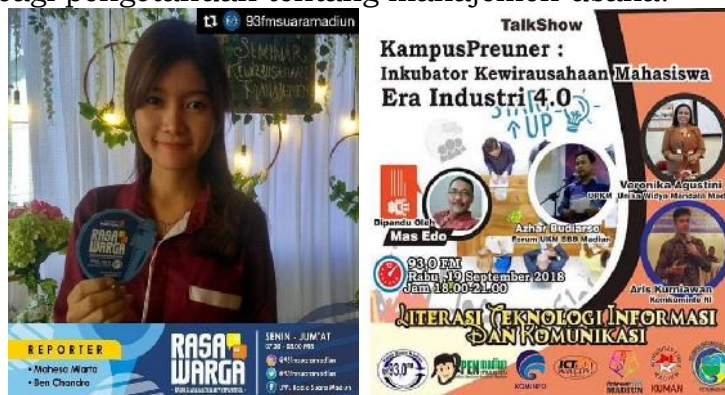
Gambar 8. Dialog Interaktif di Radio Suara Madiun

Dialog kewirausahaan di radio, bertujuan untuk memberikan motivasi bagi mahasiswa di Kota Madiun dan sekitarnya untuk berani berwirausaha, dan dengan didampingi oleh dosen, tenant dan mahasiswa yang ditugaskan oleh program studi sebagai tim narasumber diberikan kesempatan untuk berbagi pengalaman dalam merintis usaha serta berbagi pengetahuan tentang manajemen usaha.