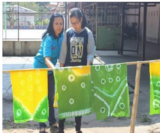
Gambar 7. Pelatihan Batik Tie Dye Kepada Salah Seorang Tenant

Pelatihan manajemen usaha meliputi pelatihan pemasaran berbasis IT yaitu pelatihan desain grafis dan website, pelatihan penyusunan proposal usaha, pelatihan kelayakan usaha, serta pelatihan pembukuan usaha. Metode yang digunakan dalam pelatihan ini melalui tatap muka, di mana narasumber menjelaskan tentang kewirausahaan, rencana usaha ( business plan ), dan manajemen usaha serta diskusi kelompok antar-tenant yang didampingi narasumber agar tenant berani mengemukakan pendapatnya dan mendorong untuk berpikir kreatif.