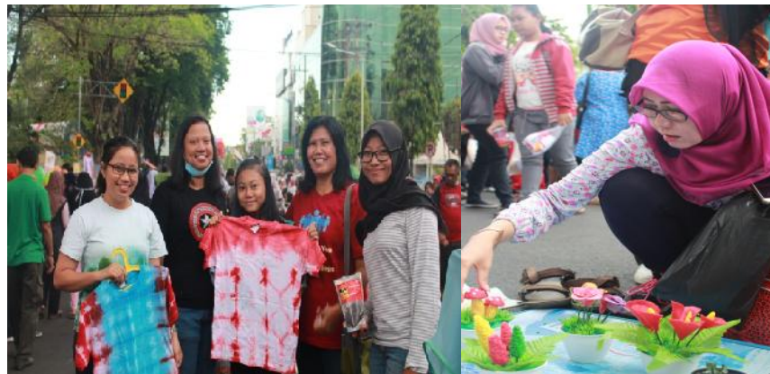
Gambar 10. Berjualan di Lokasi CFD