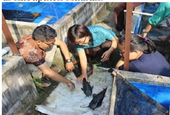
Gambar 6. Pelatihan Pembibitan Ikan Lele Bagi Para Tenant

Pelatihan pembuatan kain batik ikat dan celup dilaksanakan di kampus WIMA bekerja sama dengan Batik Sekartaji dan Omah Batik Veronika Madiun. Peserta pelatihan selain tenant PPK WIMA yang berminat juga ditujukan bagi mitra masyarakat peminat batik tulis dan komunitas pengrajin batik yang telah menjadi binaan tim dalam dua tahun terakhir, dengan tujuan memberikan tambahan keterampilan dalam teknik membuat kain batik.