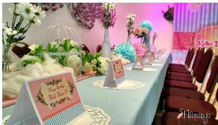
Gambar 1. Usaha Rintisan Tenant (Jasa Dekorasi)