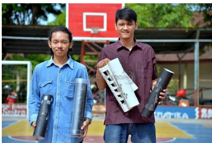
Gambar 2. Usaha Rintisan Tenant (Lampu Hias Paralon)

Di lain pihak para tenant menghadapi kendala dalam hal kemampuan manajemen usaha, permodalan dan jejaring usaha untuk merintis atau mengembangkan usaha yang dipilih. Hal lain yang perlu dilakukan adalah peningkatan jumlah alumni WIMA yang memilih berwirausaha melalui peningkatan spirit kewirausahaan sedini mungkin, saat mahasiswa masih menjalani proses perkuliahan, sehingga diharapkan semakin meningkat pula mahasiswa WIMA yang memiliki ide-ide kreatif dan inovatif yang dapat memperoleh pendanaan dari Belmawa Dikti. Untuk itu tim pengembangan kewirausahaan WIMA melakukan berbagai upaya untuk terus menumbuhkembangkan jiwa berwirausaha dan melakukan pendampingan agar spirit berwirausaha terus berkobar melalui program pengembangan kewirausahaan (PPK) dengan tahapan: (1) fase kesadaran awareness (2) fase entrepreneurship capacity building , dan (3) fase institutionalization usaha baru, yang didanai oleh Direktorat Riset dan Pengabdian Masyarakat. Dengan PPK tersebut diharapkan dapat memotivasi mahasiswa WIMA sebagai pencipta lapangan kerja bukan pencari kerja.