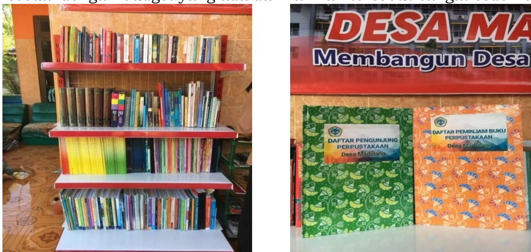
Gambar 5. Penyiapan Rak Perpustakaan dan Buku Daftar Pengunjung serta Daftar Peminjam Buku

Perpustakaan Mini di desa Madulang, dengan berbagai macam buku dari buku pelajaran, novel, maupun buku-buku umum lainnya yang disambut antusias oleh anak-anak Desa Madulang. Perpustakaan tersebut