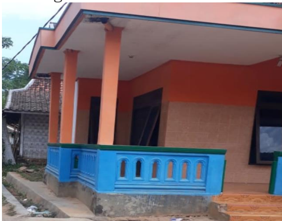
Gambar 2. Rumah Bapak Fauzi sebelum digunakan untuk perpustakaan Mini Desa Madulang

Para pelaku pembentukan tersebut bermusyawarah untuk merumuskan kata sepakat berdasarkan aspirasi, keinginan dan kepentingan masyarakat untuk membangun perpustakaan mini di Desa Madulang dimana tempatnya yang paling tepat yaitu di rumah Bapak Fauzi (salah satu perangkat desa Madulang) dan membantu menambah buku-buku pembelajaran untuk PAUD yang berada di rumah Klebun Desa Madulang.