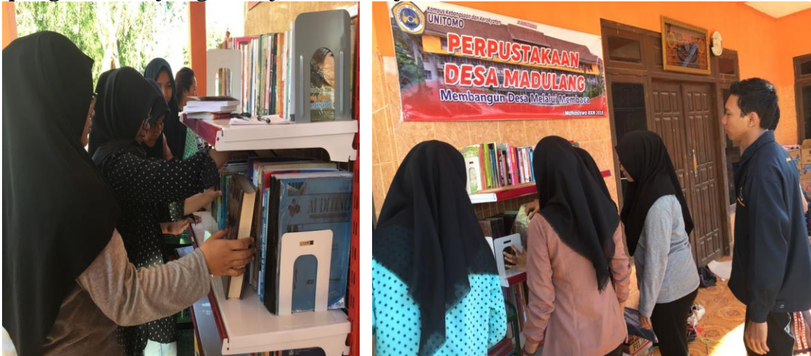
Gambar 4. Penataan Letak Literatur/Buku-Buku, Majalah dan Koran