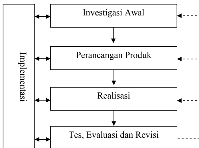
Gambar 2. Modifikasi Model Umum Desain Pendidikan

Model pengembangan Plomp masih terlalu umum, dalam penelitian ini peneliti sedikit memodifikasi model pengembangan Plomp tersebut. Hasil modifikasinya (Rahajeng, 2009:47) sebagai berikut: (1) tahap investigasi awal, (2) tahap perancangan, (3) tahap realisasi, (4) tahap ujicoba (tes), evaluasi dan revisi. Sedangkan tahap implementasi tidak dilakukan karena (1) revisi dari hasil ujicoba sudah cukup sebagai implementasi di lapangan (2) perangkat pembelajaran ini tidak secara luas diimplementasikan di sekolah-sekolah. Modifikasi model pengembangan Plomp sebagai berikut: