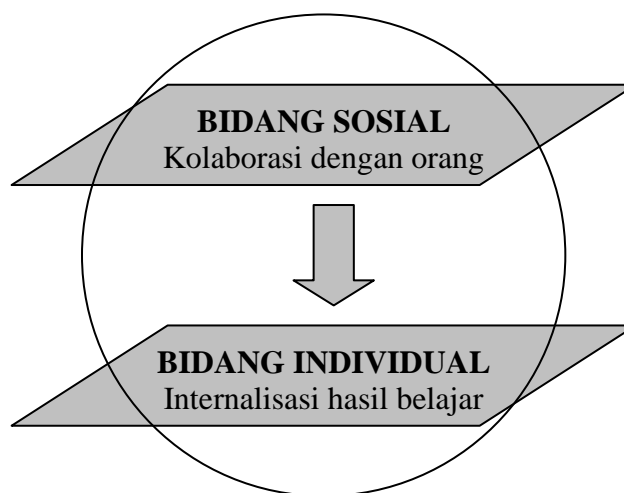
Gambar 1. Dua Level Pembelajaran (Jones & Thornton, 1993:21)

Setiap anak akan melewati dua tingkat ( level ) dalam proses belajar, yaitu pertama pada level sosial, yaitu anak melakukan kolaborasi dengan orang lain dan kedua pada level individual, yaitu anak melakukan proses internalisasi (Jones & Thornton, 1993:18). Menurut Solso (1991:384), internalisasi merupakan proses transformasi tindakan eksternal (perilaku) menjadi kerja psikologis internal (proses). Jones & Thornton (1993:21) menggambarkan kondisi ini seperti gambar di bawah ini.